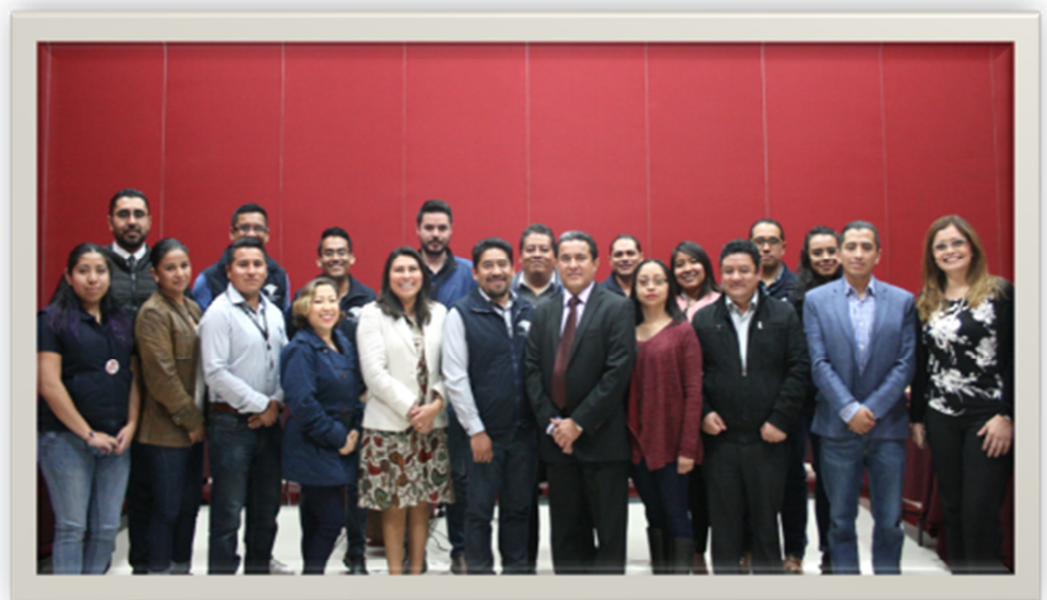
Participantes del Taller de Autoevaluación de la Integridad IntoSaint del OFS.